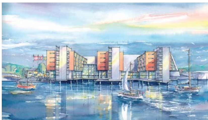
Rica Nidelven Hotel, Trondheim

Nidelven, stille og vakker du er, her hvor jeg går og drømmer. Drømmer om deg som jeg hadde så kjær, nu er det bare minner.